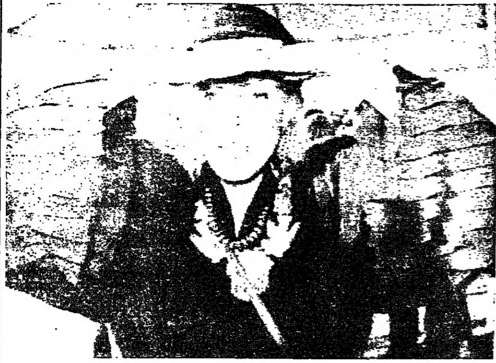
جونني ميتشيل، المرشحة لنيل جائزة غرامي، المركز الذي كانت تقام فيه حفلة تقديم الجوائز في لوس أنجلوس - ر